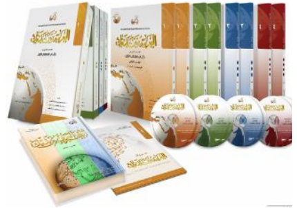
Le manuel 'Al'arabiyya bayna yadayk' (l'arabe entre tes mains appliqué à la FSIP.

Cependant, au début du processus d'apprentissage, le recours à la langue française aura lieu afin de permettre aux apprenants de mieux saisir les notions de bases, avant de s'en détacher petit à petit, au fur et mesure des cours.